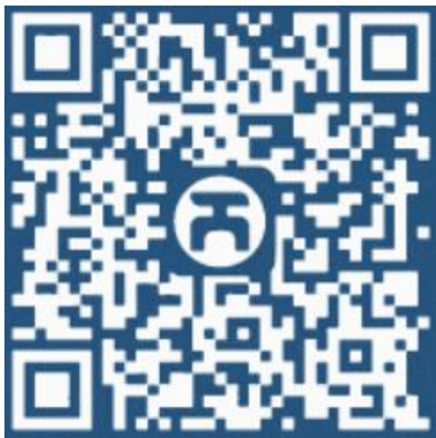
“天能控股集团” 微信公众号