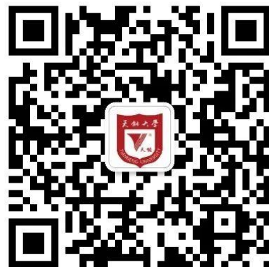
“天能量” 微信公众号